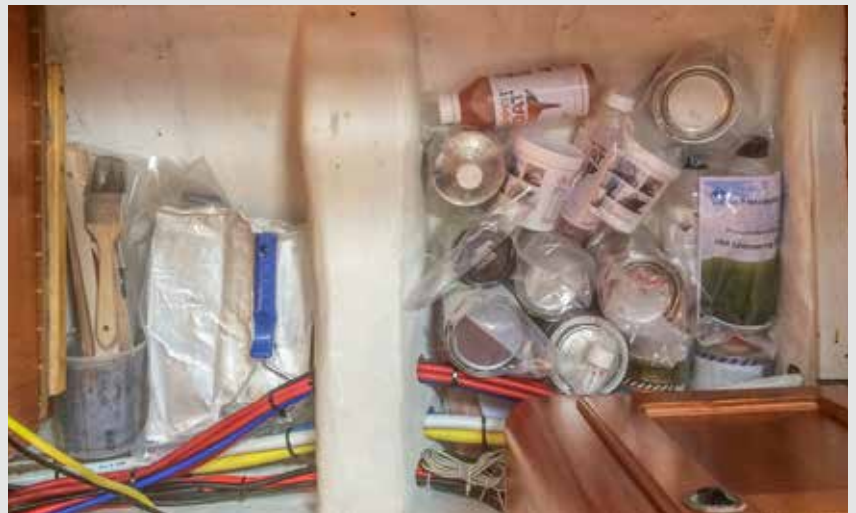
Vakuumpackade kan vi lägga färg, lösningsmedel mm direkt under durken i byssan.

Naturligtvis kan man inte bara ta bort utan vi jobbar hela tiden med att reducera förutsättningarna för fukt och kondens, då är avfuktaren vårt främsta vapen. Ytor som visar tecken på mögel tvättar vi med ättiksvatten. 🍷