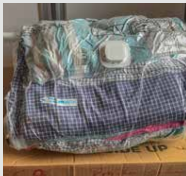
En nytvättad omgång sängkläder och handdukar krymper i volym och håller sig fräsch tills det är dags att använda den.