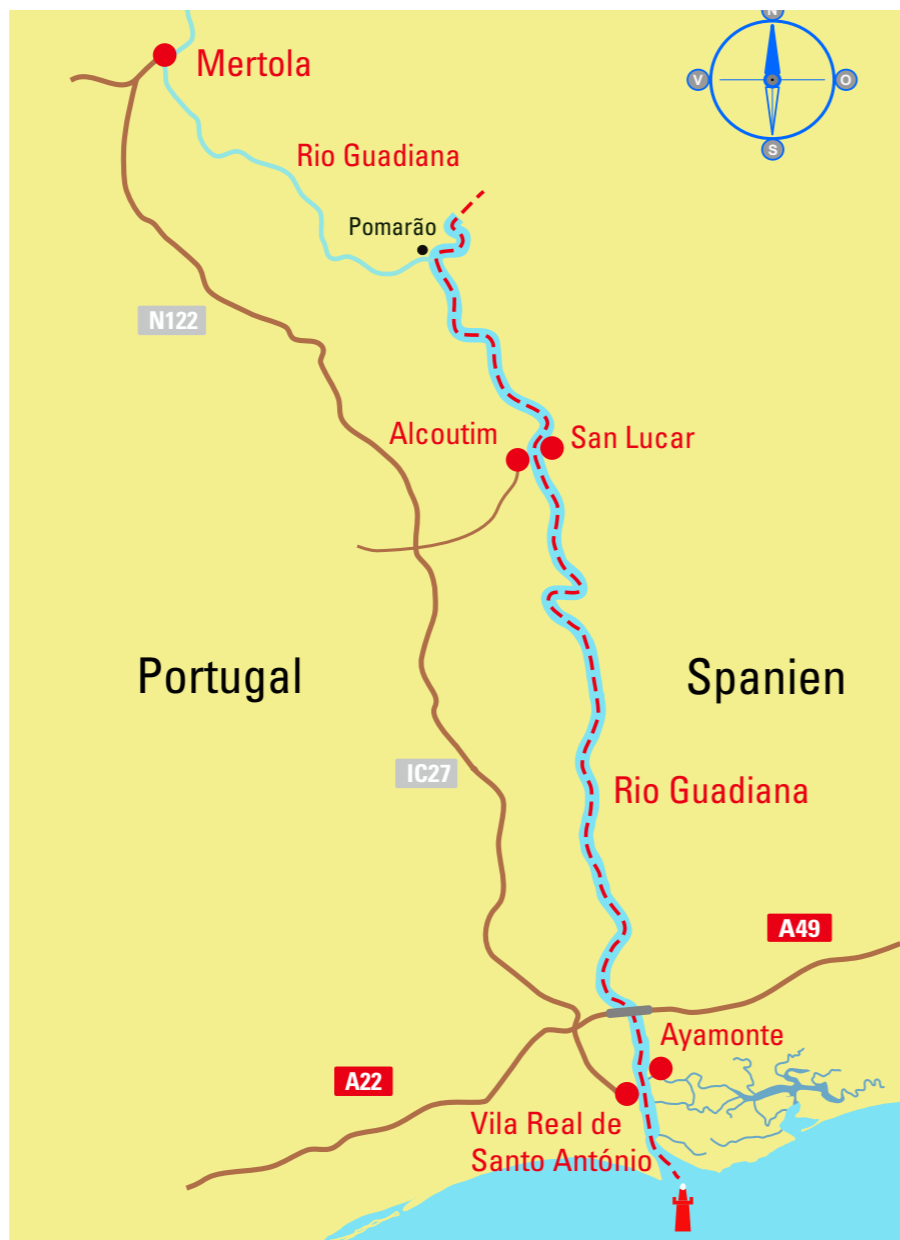
I sin nedre del bildar Guadiana gräns mellan Portugal och Spanien.

Vi fick se Jesus rida in på vad vi trodde